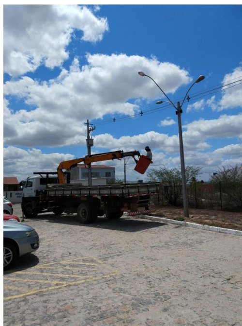
Instalação de sensores e troca de lâmpadas