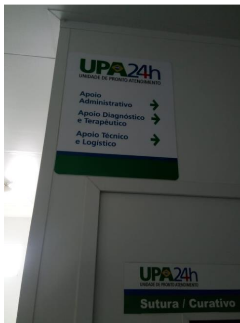
Placas de Orientação Internas